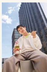
Caja de Luz 3 More feeling - Sanum