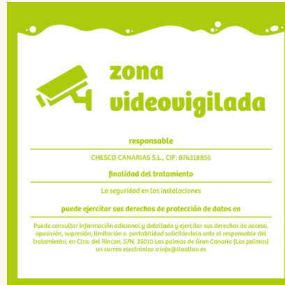
Vinilo Zona de Vigilancia Añadir en comentarios *nombre sociedad*