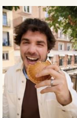
Caja de Luz 7 More feeling - brioche