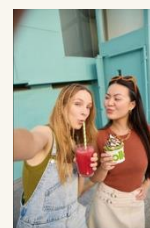
Caja de Luz 4 More feeling - amigas