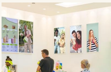
Caja de luz 49º ó 55º