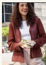
Caja de Luz 5 More feeling - Ilaovasito