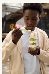
Caja de Luz 1 More feeling - Luxe

Diseños pertenecientes a línea visual oficial de Ilaollao: “More Feeling”.