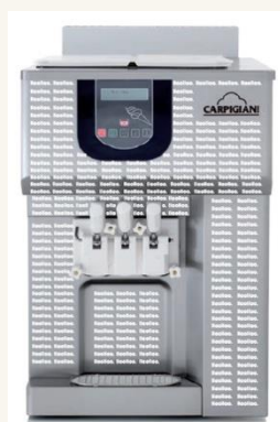
Vinilo Carpigiani 193 STEEL P