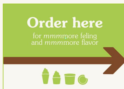
Cartel catenarias doble lado