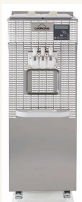
Vinilo Carpigiani TRE B AV EVO