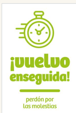
Cartel "vuelvo enseguida"

Forex impreso de 5mm + estructura de madera