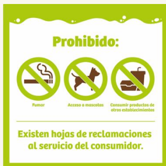
Vinilo prohibiciones y Reclamaciones Vinilo.