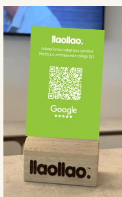
Table tent GMB – Reseñas

Forex impreso de 5mm + estructura de madera