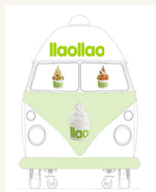
Vinilo productos ventanas frontales FT: