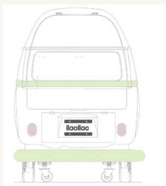
Vinilo natural frozen trasera FT + placa