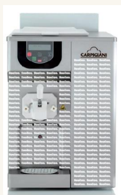
Vinilo Carpigiani 191 STEEL P