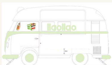
Vinilo Productos ventanas lateral FT