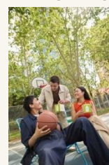
Caja de Luz 6 More feeling - Ilaobox