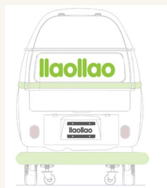
Vinilo logo trasera FT