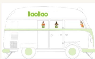
Vinilo llaollao puerta detrás FT XL o pequeño Vinilo.