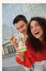
Caja de Luz 7 More feeling - Tarrinas