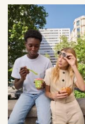
Caja de Luz 7 More feeling – next y brioche