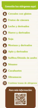
Vinilos Alérgenos Vinilo nanaventosa.