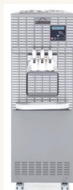
Vinilo Carpigiani SUPER TRE B AV EVO