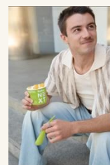
Caja de Luz 2 More feeling - Next