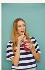
Caja de Luz 7 More feeling - sensaciones